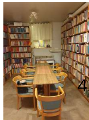
Biblioteket på Hagagatan har fått nya stolar och blivit ljus och trivsamt!