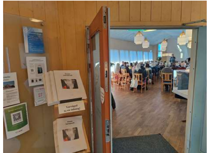
Entrén till Robyggesalen.