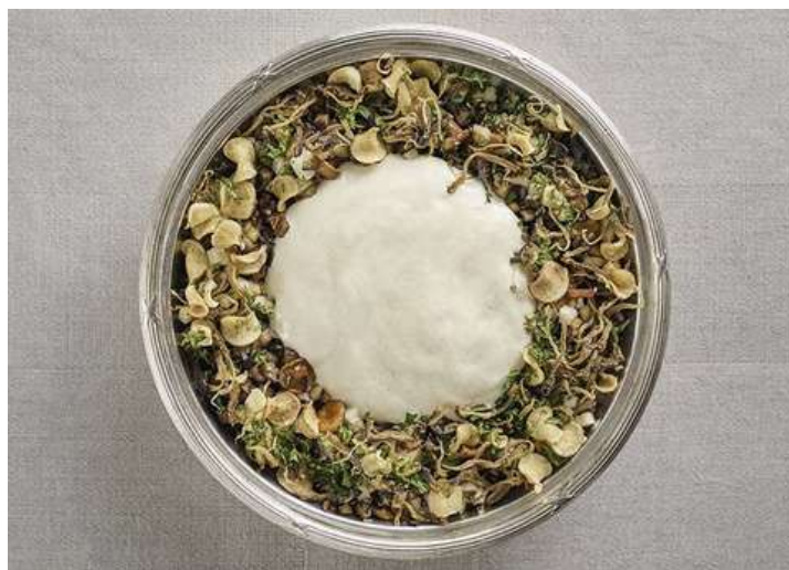
“Kulturgröten” på klippt korn, vild och odlad svamp,

På Nobelmiddagen 2024 serverades en innovativ gröt som var en del av förrätten. Den bestod av kornbulgur från Hidden in Grains och Warbro Kvarn. Denna bulgur har behandlats med en speciell hydrotermisk metod som bryter ner fytinsyra i spannmålen. Detta gör att mineraler som järn och zink blir mer tillgängliga för kroppen, vilket kombinerar näringsmässiga fördelar med hållbarhet och innovation.