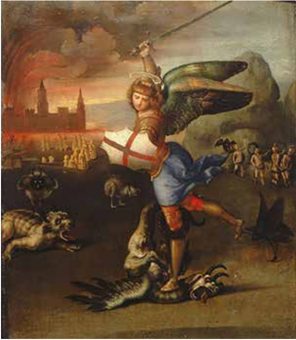
Målning av Rafael Sanzio, 1500-talet. Läs betraktelsen på sidorna 10-11.