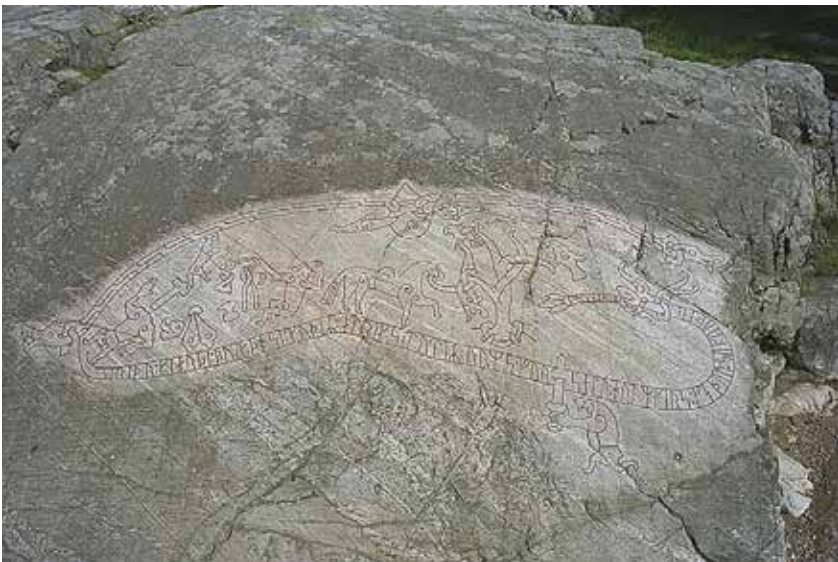
Sigurdsristningen, 1000-talet. Läs betraktelsen på sidorna 10–11.