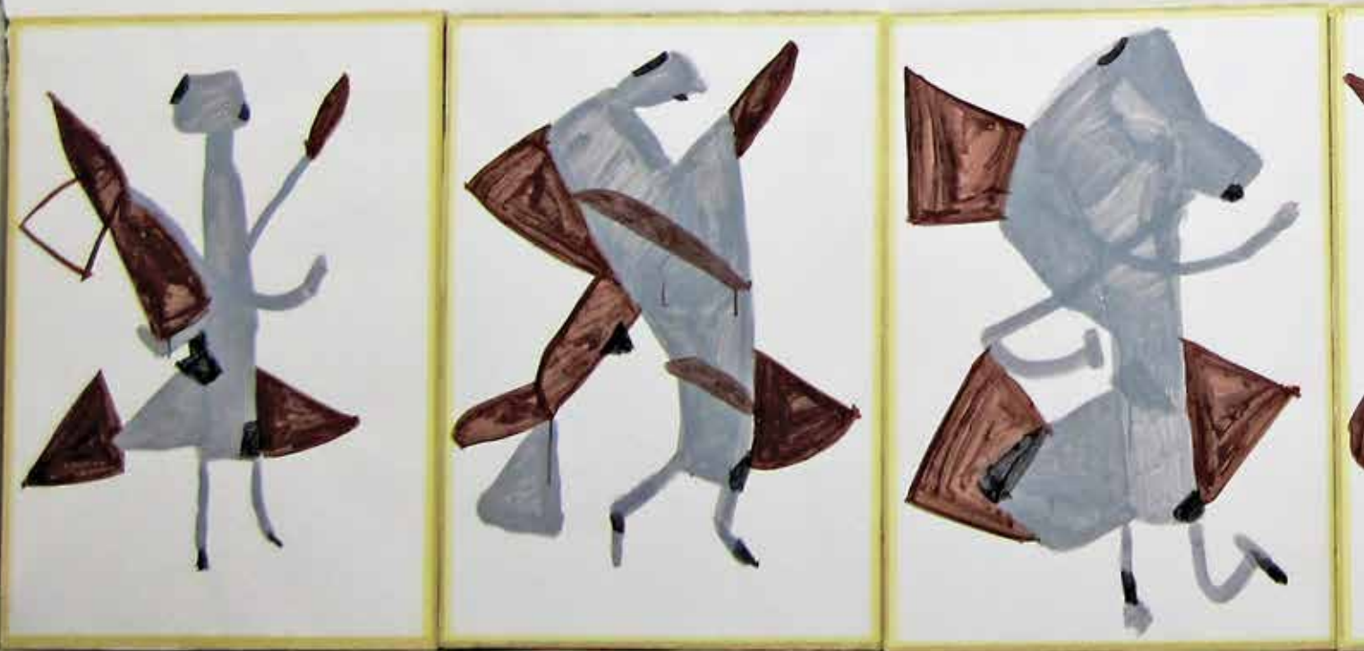
Reidun Larsen, "Eurytmifigur", 2012. Vidaråsens "Malerverksted" Steg mot inkludering under Majdagarna, sid. 21.