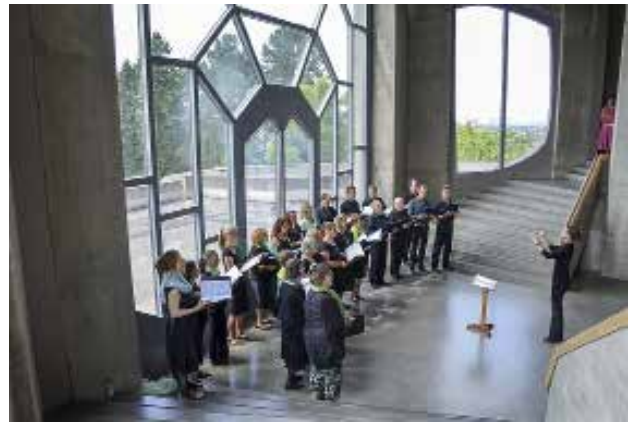
Aava kören i Goetheanum. Under konferensen Norden i Goetheanum, 30 juli - 2 augusti 2015.