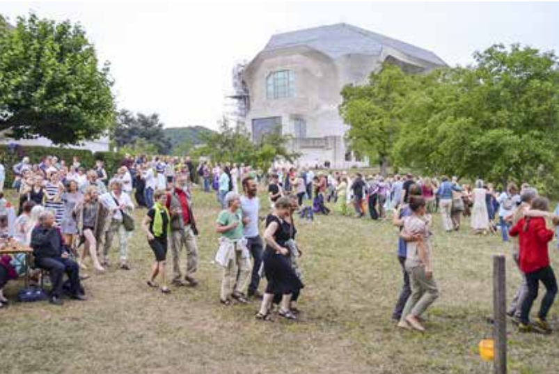
Nordisk folkdans. Under konferensen Norden i Goetheanum, 30 juli - 2 augusti 2015.