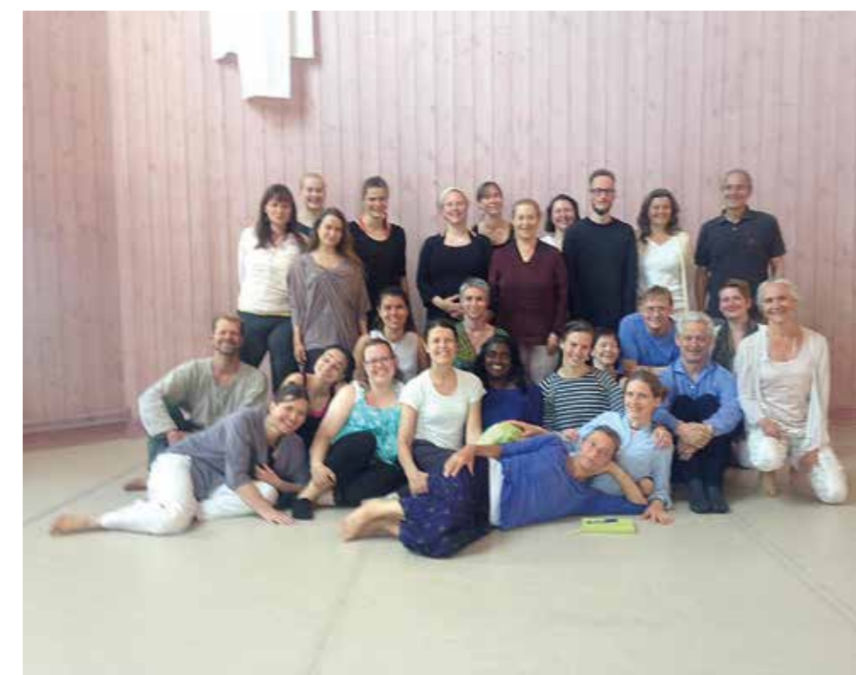
Nordisk eurytmiutbildningsträff i Järna, Kristihimmelfärdshelgen 2017. Läs krönika på sidan 10.