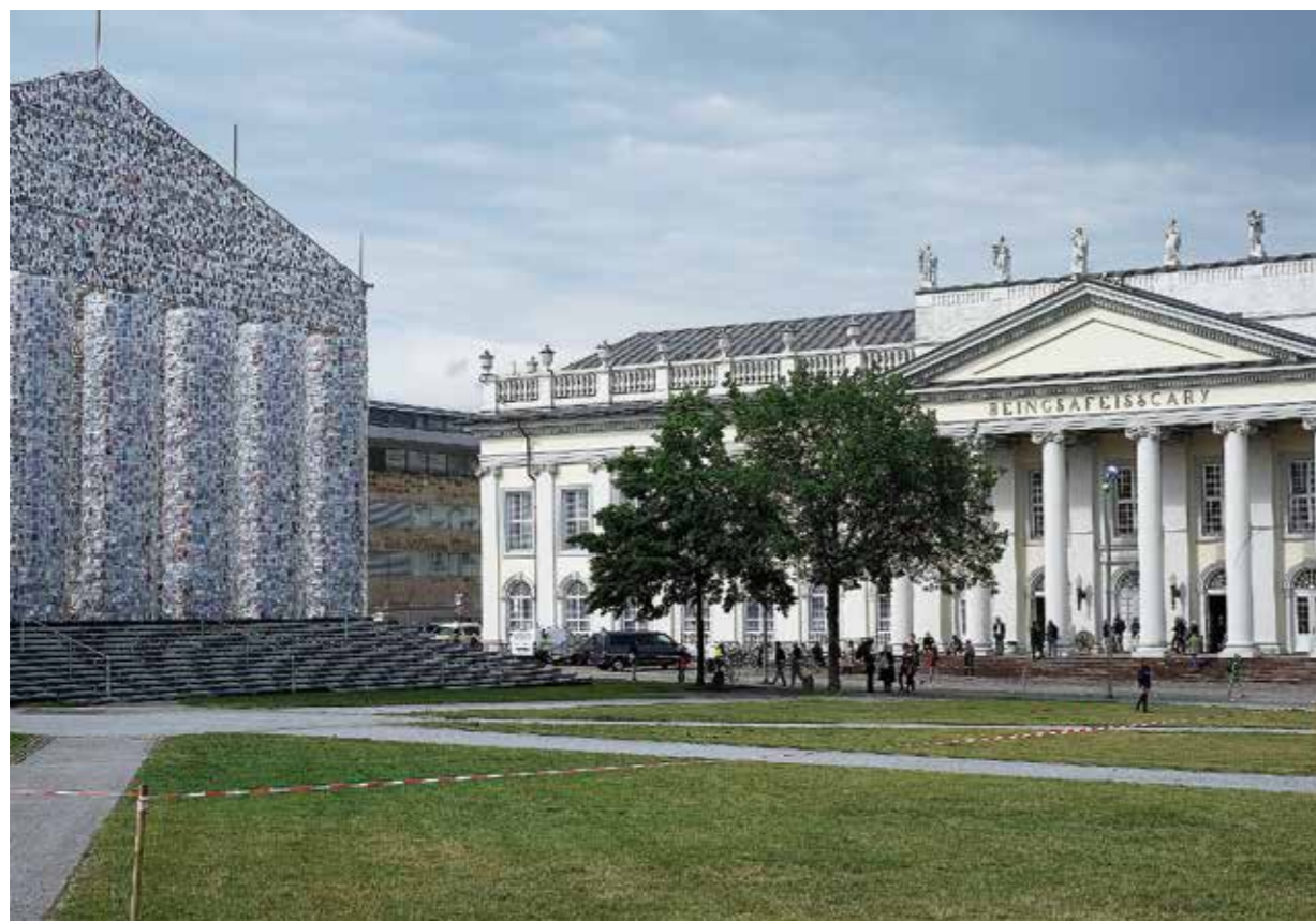
1933 anordnades bokbål på Friedrichsplatz i Kassel. Idag står på samma plats installationen "Parthenon of books". Den argentinska konstnären Marta Minujín har låtit bygga en rekonstruktion av templet på Akropolis i Athen som nu succesivt kläs in med en gång eller fortfarande förbjudna boktitlar. Goetheanum Dokumentation har bidragit med en bok av Rudolf Steiner som var förbjuden under Tredje riket. Och till höger läser vi istället för "Museum Fridericianum": "Being Safe is Scary". Banu Cennetoglu har skapat ett på flera sätt typiskt verk för årets politiskt laddade documenta 14. Documenta äger rum var femte år sedan 1955 i Kassel, i år även i Athen, och är jämte Venedig biennalen den mest prestigefyllda konstutställningen.