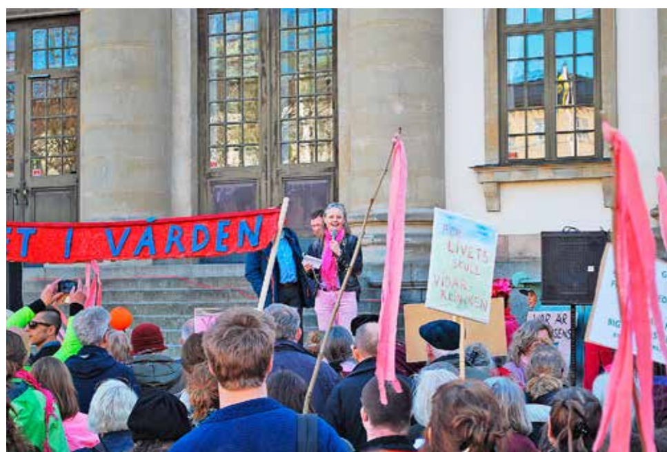
Mannifestation för Vidarkliniken i Stockholm 27 mars 2017. Flera hundra personer samlades vid Mynttorget i Gamla stan och tågade därifrån till Landstingshuset på Kungsholmen, där hölls tal och protesterades mot Stockholms landstings beslut att inte förlänga sitt avtal med Vidarkliniken. Se video med intervjuer på: goo.gl/czEgBP